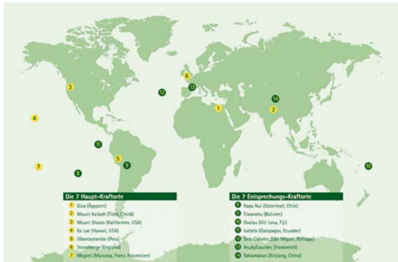
Karte mit den 7 Haupt- und ihren 7 Entsprechungs-Kraftorten

Je nach Quelle kommen wir also von anderen Sternen respektive Sonnen-Systemen aus den Himmeln oder aus geistigen Welten und können dorthin zurückkehren. (Wir kommen im 7. Schritt „Erhebe Dich in der Wendezeit“ darauf zurück)